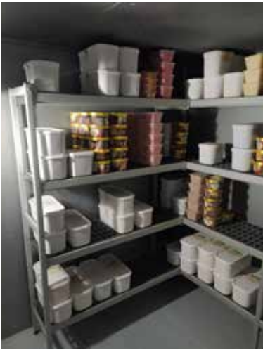
Beispiel: Eis Lagerung direkt nach der Bauernhof Produktion

➔ Ideal für die Lagerung von Tiefkühlprodukten