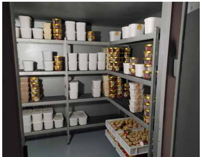
Regale in L auf 4 Ebenen

Angaben ohne Gewähr. Die Eigenschaften, Abmessungen und Daten sind nur als Richtwerte anzusehen.