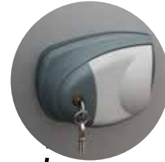
Mit Schlüssel abschließbar