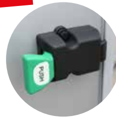
Innenöffnung System (Sicherheit)