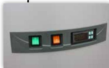
Schalttafel des Kühlaggregats und Lichtschalter (220 V)