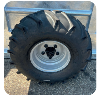
Räder 10.0/80 - 12