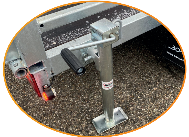
Handkurbel, Ständer am Boden