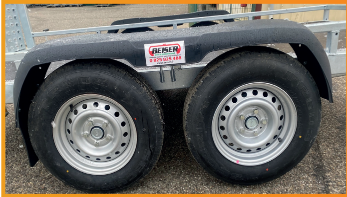
Räder 185R14C/102/100S - Zweiachser