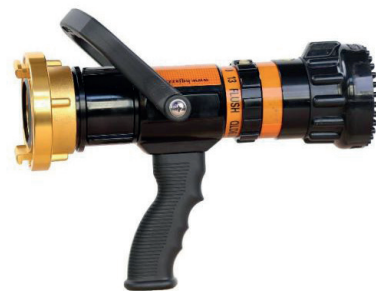
Feuerlanze ref. 0199220091