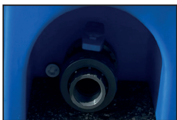
PVC-Ventil Diam. 1,5"