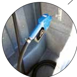
Automatischer Aufroller mit 6M Schlauch