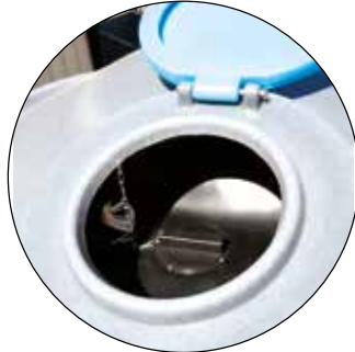
Mannloch-Zugang vom Tank